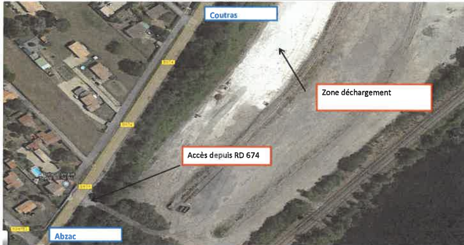
Plan schématique du lieu de livraison

SECOURS: Pompiers : 18 ou 112 SAMU : 15 Hôpital de Libourne : 05.57.55.34.34